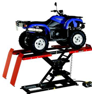
Modulift 1200 MOP

Vous trouverez d'autres modèles au site www.hermannbaur.ch