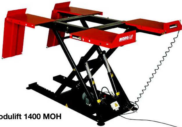
Modulift 1400 MOH