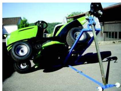
Basculeur de tracteurs tondeuses MBK 601