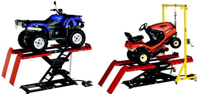
Modulift 1200 MOP

Weitere Modelle finden Sie unter www.hermannbaur.ch